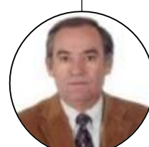
Cultura António Perdigão