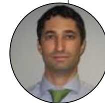
Cultura José Diegues