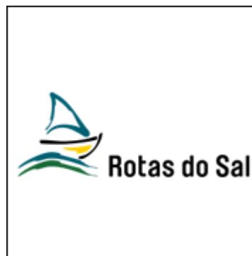
Rotas do Sal