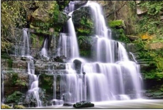
Visita ao Gerês