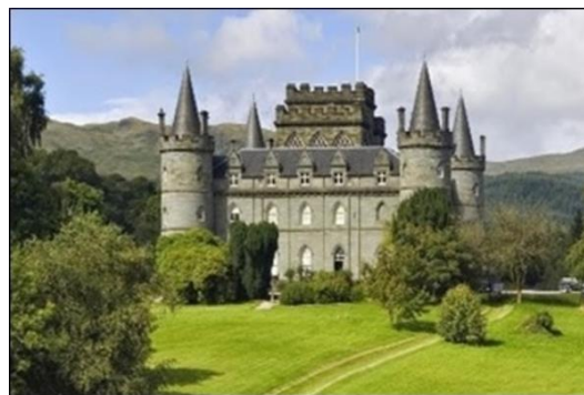
Viagem à Escócia