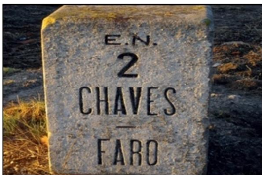
EN2 – A Mítica Estrada Nacional 2