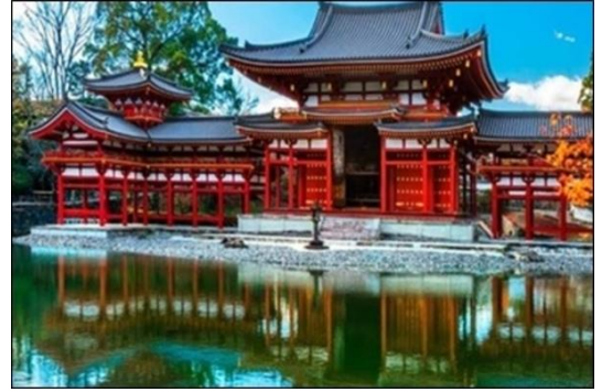
Viagem ao Japão