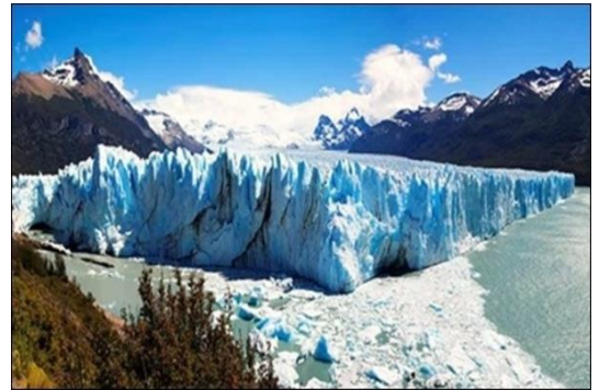
Viagem à Argentina e Chile