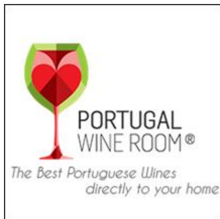
Portugal Wine Room

Conheça os benefícios que os sócios têm com as empresas: