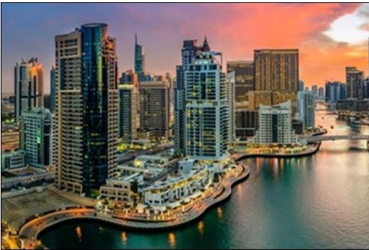
Cruzeiro Golfo Árabe