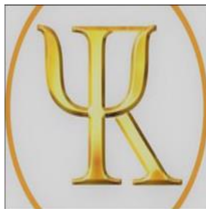
Consultas de Psicologia