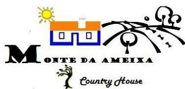
A Casa de Campo - O Monte da Ameixa

Conheça os benefícios que os sócios têm com as empresas: