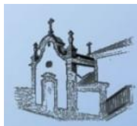
Casa da Capela - Turismo Rural