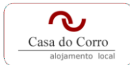
Casa do Corro - Alojamento local