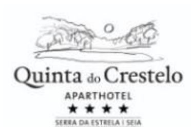
Quinta do Crestelo