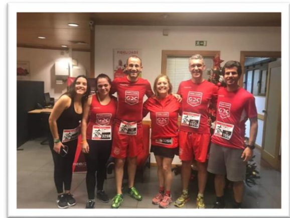
São Silvestre da Madeira