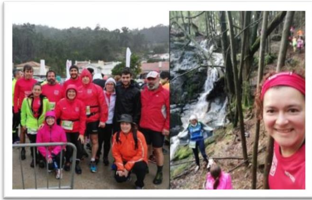
I Trilhos de Viana