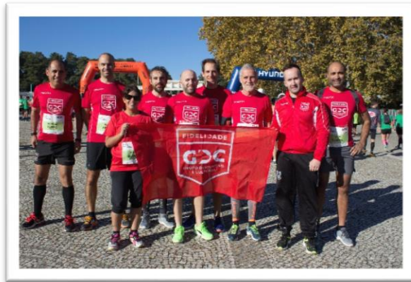
Corrida do Jamor