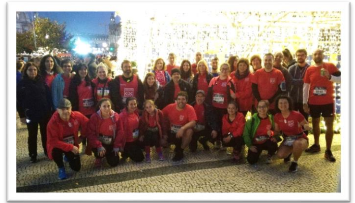
São Silvestre do Porto