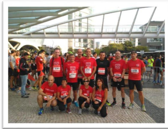
Corrida Vasco da Gama