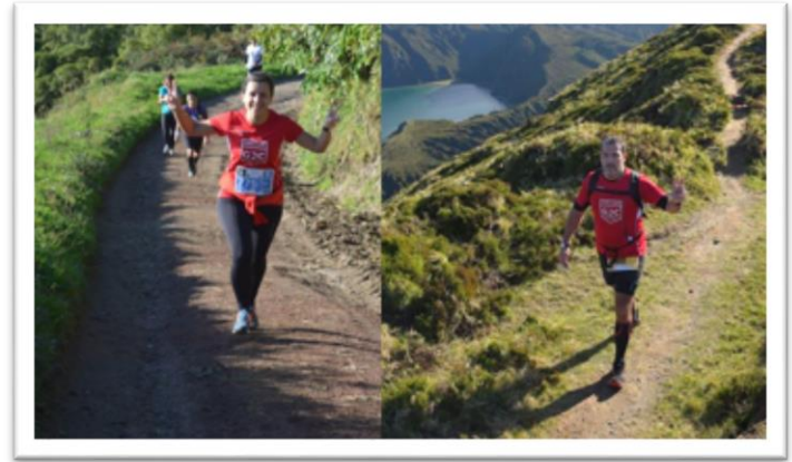
Epic Trail Run Azores