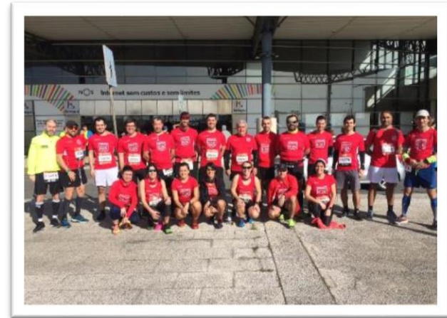
Meia Maratona de Lisboa