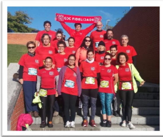
Trail das Nozes