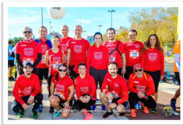
Corrida GP Natal